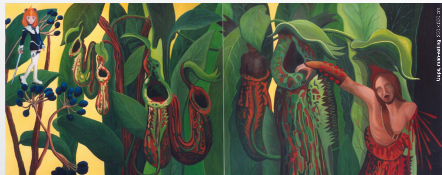
Ups, man-eating 200 x 500 cm

Die Malerin und Zeichnerin mit kroatischen Wurzeln überrascht mit Sehnsuchtsbildern einer konfliktfreien Welt. Die vordergründig liebevolle Malerei entführt in eine ungeschönte Realität, in der immer wieder unerwartete Bildelemente den Bildraum betreten. Sie fordern den Betrachter und stellen ihn auf eine harte Probe. Denn das vermeintlich Schöne, Unschuldige wird von Überraschendem, Unangenehmem unterwandert. Harmloses vermengt sich mit Grauensvollem. Letztendlich versöhnen die satten, leuchtenden Töne, die einen positiven und optimistischen Eindruck entstehen lassen. Ellen Semen meint dazu: "Meine Werke sind dunkel angelegt, aber hell erwünscht. Deshalb stehen meine Sehnsuchtsbilder für eine konfliktfreie Welt."