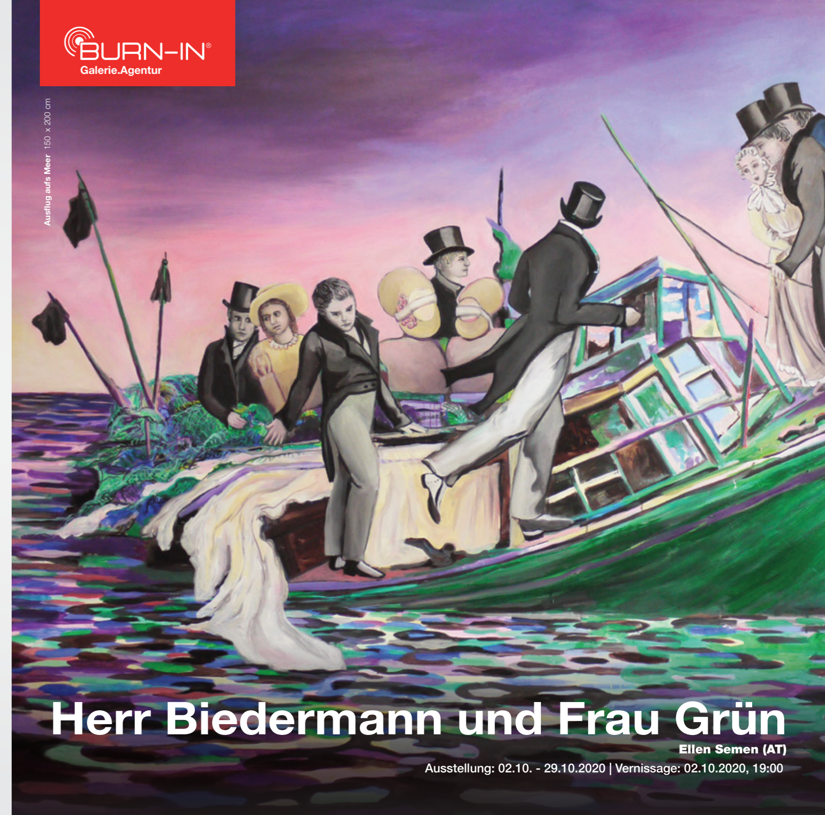
Ausflug aufs Meer | 150 x 200 cm