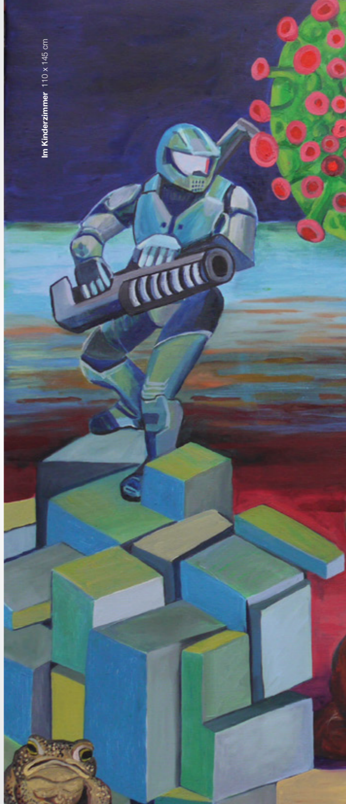
Im Kinderzimmer 110 x 145 cm