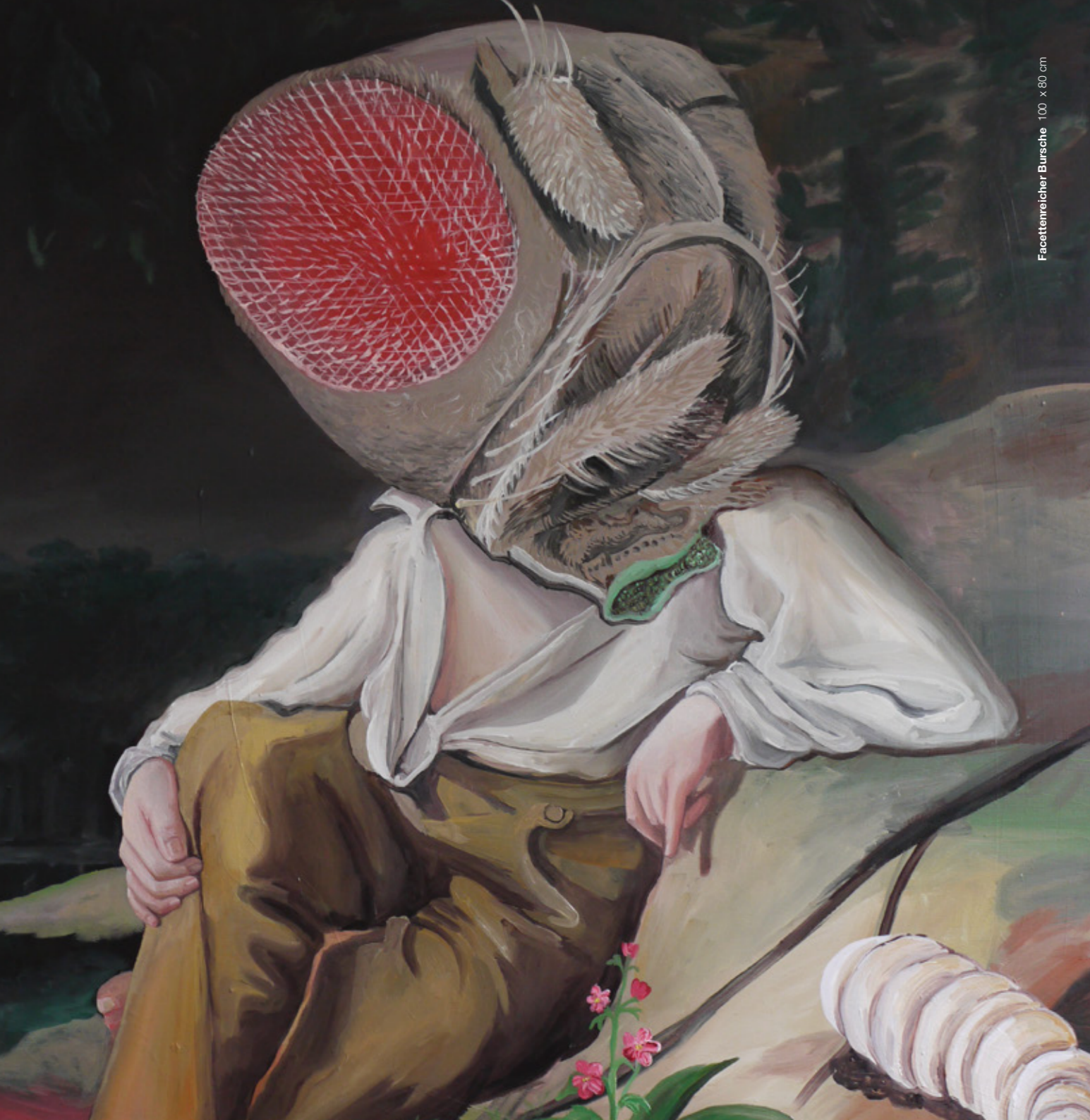
Facettenreicher Bursche | 100 x 80 cm