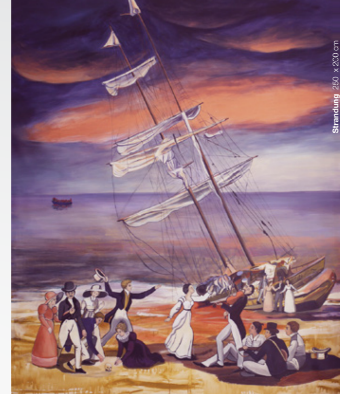
Strandung | 250 x 200 cm

Mo-Mi: 9:30-19:00 Do-Fr: 9:30-20:00 Sa: 9:30-18:00