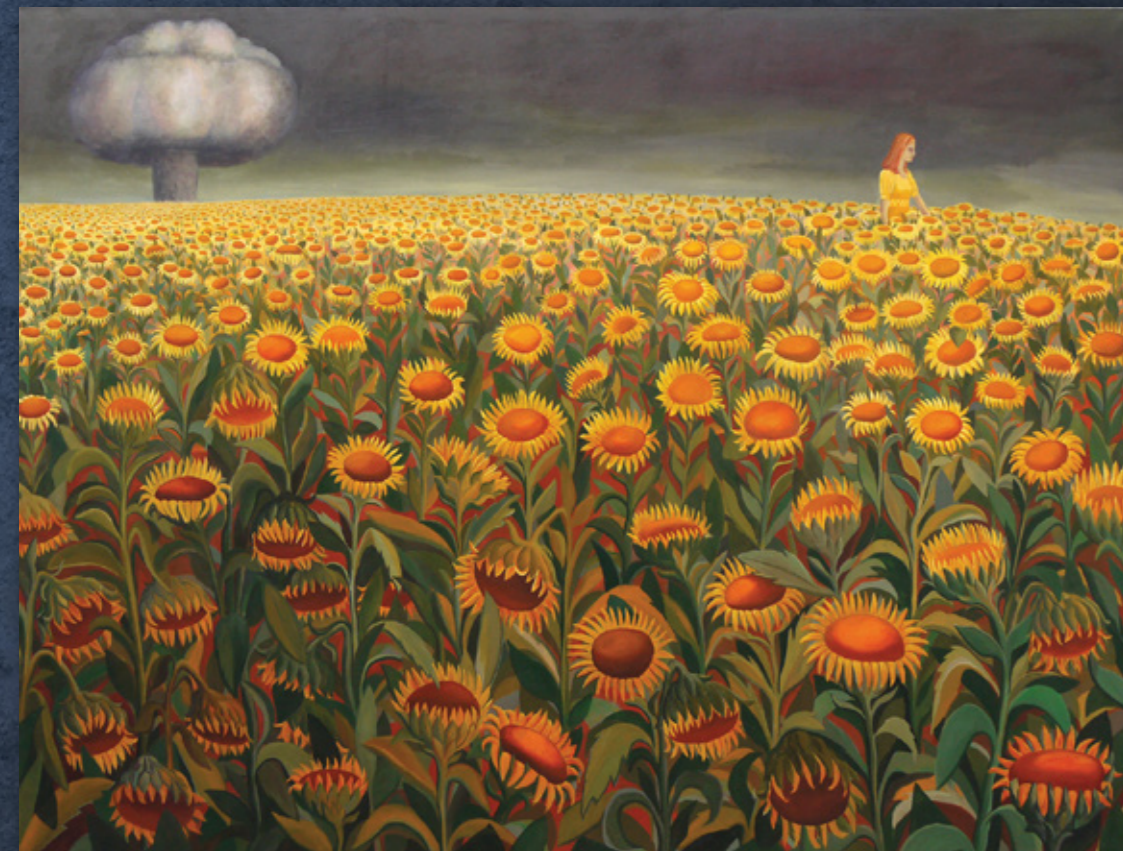
Wahrscheinlichkeit 13 200 x 280 cm