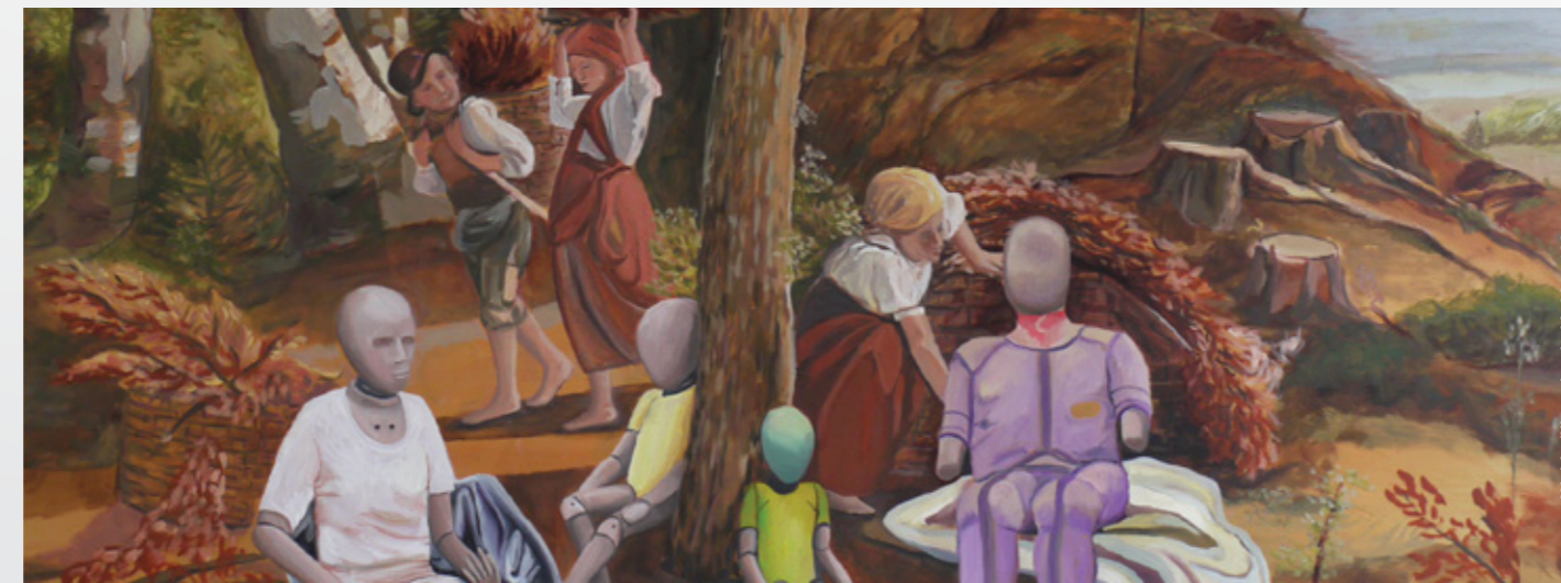
Waldmüller reloaded | 80 x 100 cm

Die in Hamburg geborene, seit 20 Jahren in Wien lebende Künstlerin hat kroatische Wurzeln und ist eine wunderbare Geschichtenerzählerin. Mit ihren gesellschaftskritischen Arbeiten erlangt sie große soziopolitische Bedeutung und führt mit ihrem Gesamtwerk und in der aktuellen Ausstellung klar vor Augen, welche Entwicklungen global schief laufen. Sie scheut sich nicht, Stellung zu beziehen, zu kritisieren. Die positive Ausstrahlung aller Werke vermittelt aber stets Hoffnung und Zuversicht auf eine positive Wende.