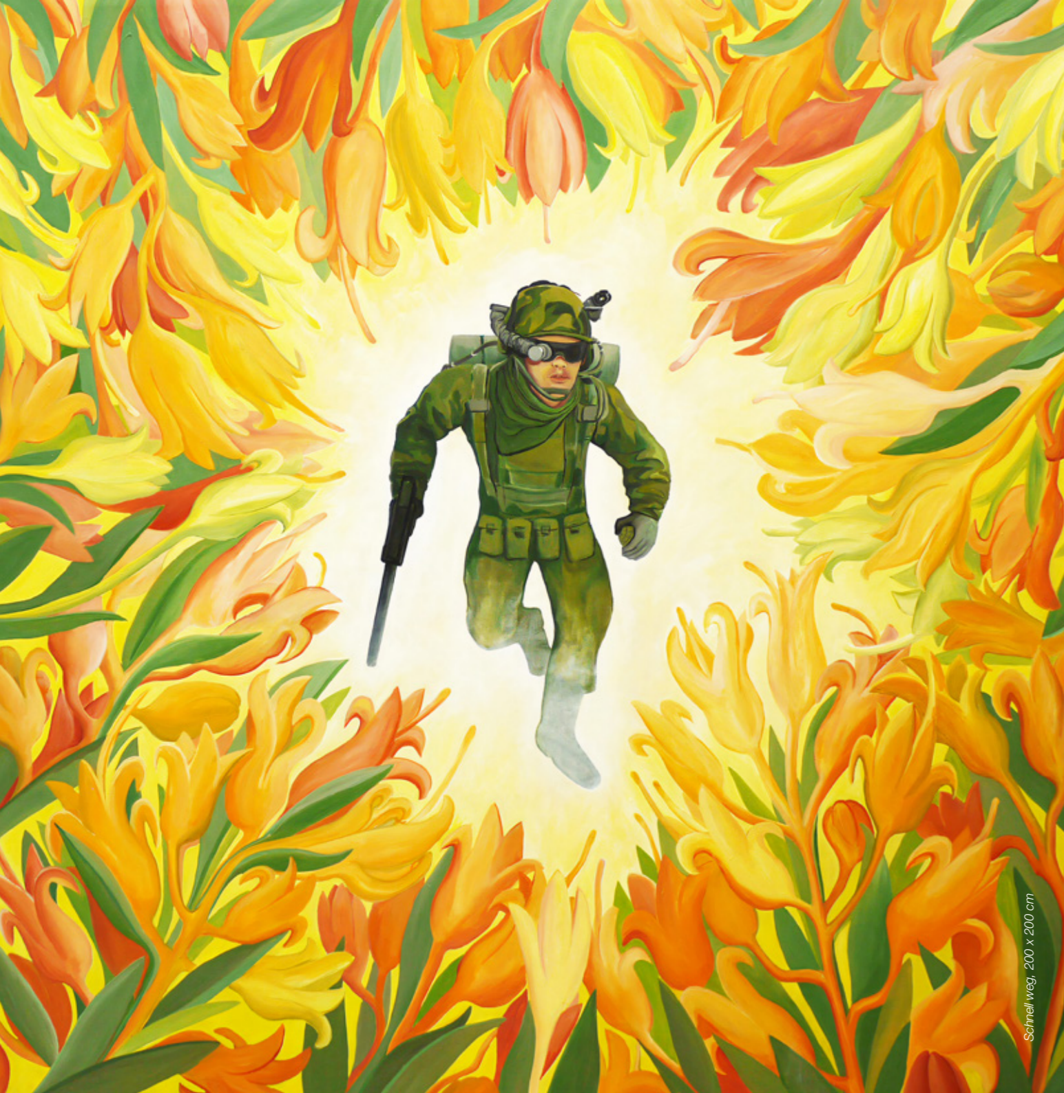
Schneidweg, 200 x 200 cm

wir laufen und lassen uns nicht treiben der mensch wird immer dumm geboren ernährt sich von ideen, die tote verloren