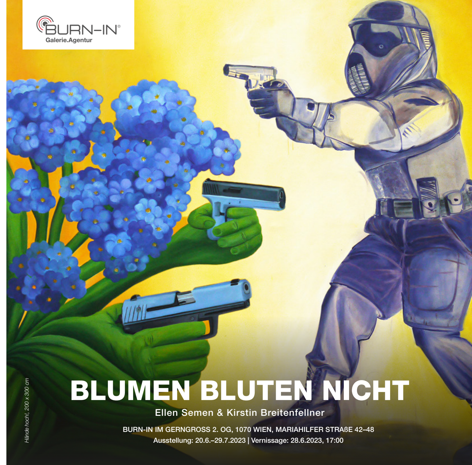
Händels hochl, 200 x 300 cm